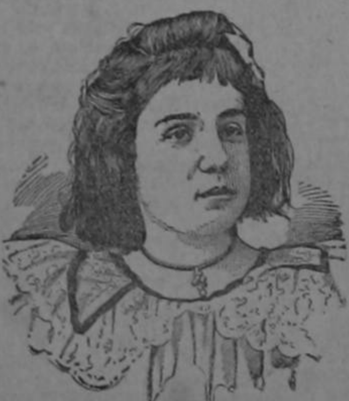
Tip. de "El Derecho"

SCOTT & BOWNE, Químicos, New York. De venta en las Farmacias